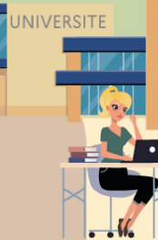
entre en doctorat et valide le sujet de la thèse en octobre 2017