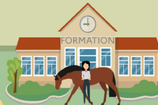
Perte d'attractivité des métiers et formations