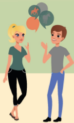
s'intéresse à l'accompagnement des personnes en reconversion