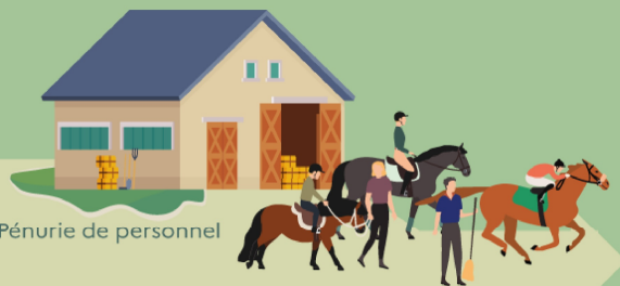
Pénurie de personnel