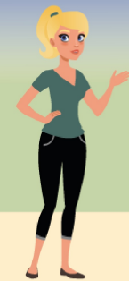
Charlène Conseillère emploi-orientation