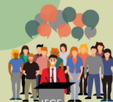
Expression du besoin de comprendre la rotation du personnel dans les écuries